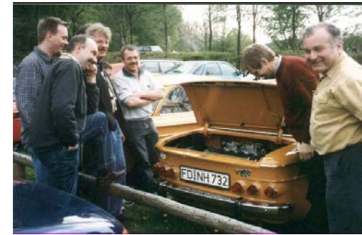
Stammtisch- Ausfahrt mit NSU